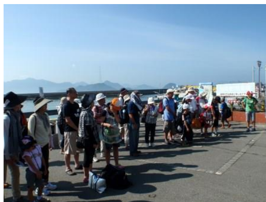
オリエンテーリング風景