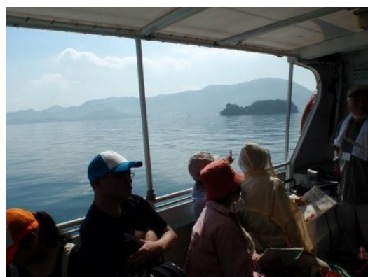
瓢箪島周辺の景色