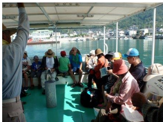
クルージング風景