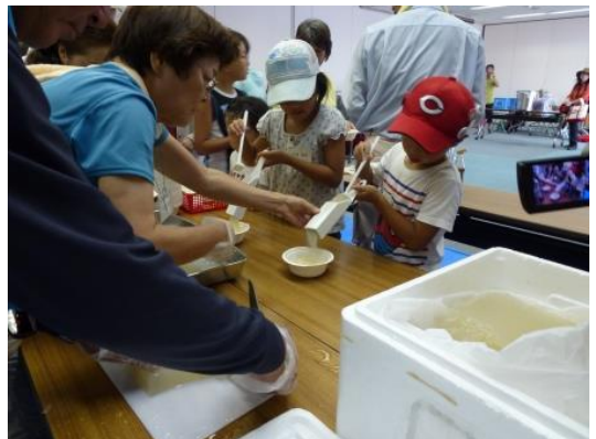
トコロテンの試食