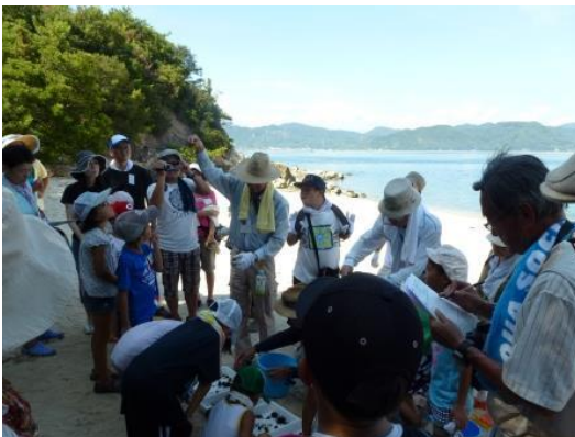
生き物観察のまとめ