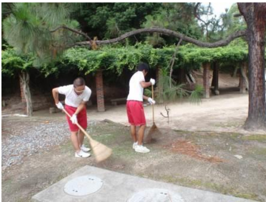
【ビジターセンター館外清掃】

今回は、広島県立忠海高等学校の生徒さんたちの就業体験の様子を紹介させていただきます。