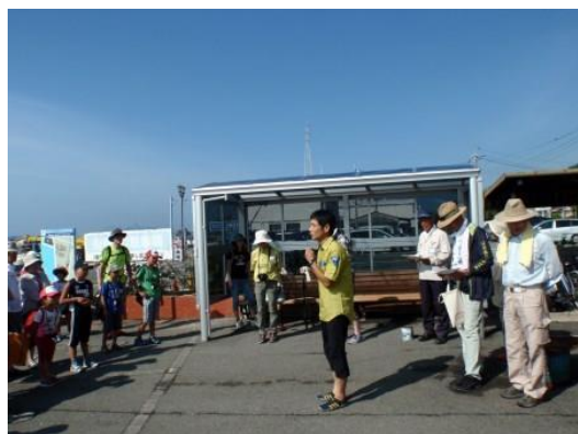
開会あいさつ (柴原自然保護官)

そして、このたびも講師のみなさまのご協力のもと無事に終了することができました。どうもありがとうございました。