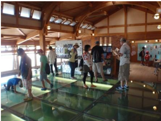
ビクターセンターの見学