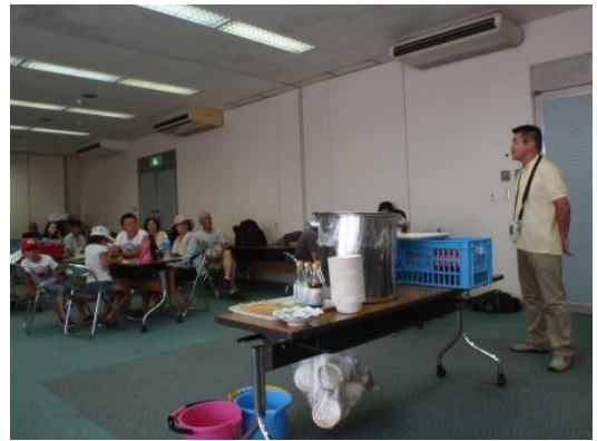
閉会あいさつ (休暇村川島課長)