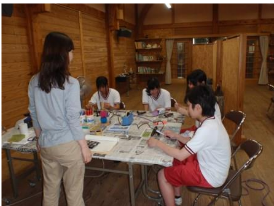
【クラフト体験受け入れ準備】

・作り方を覚えるために、見本作りをしました。体験希望者へ材料や器具の説明をしてくださいね!