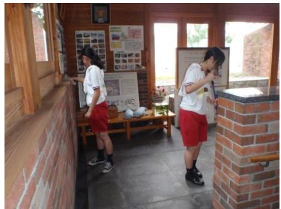
【ビジターセンター館内清掃】