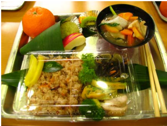
昼食 調理:大三島自然を愛する会