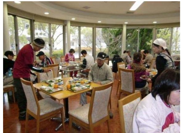
昼食風景と大三島の自然、文化解説