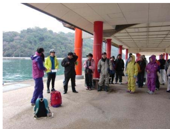
オリエンテーリング風景