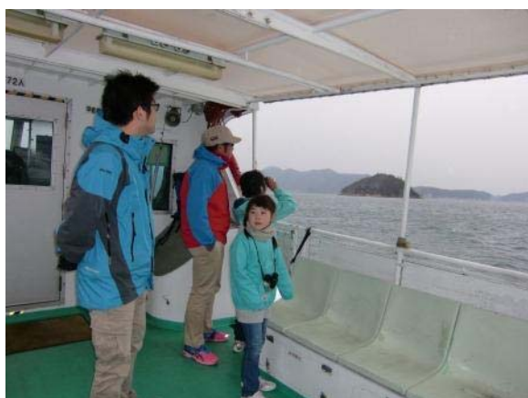
クルージング風景