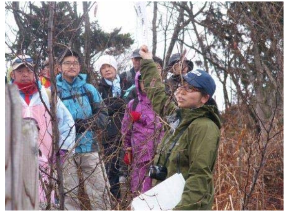
国立公園解説(山頂にて) 解説:大高下AR