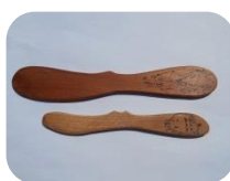
バターナイフ 大350円 小250円