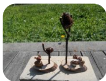
ドングリの置物 200円