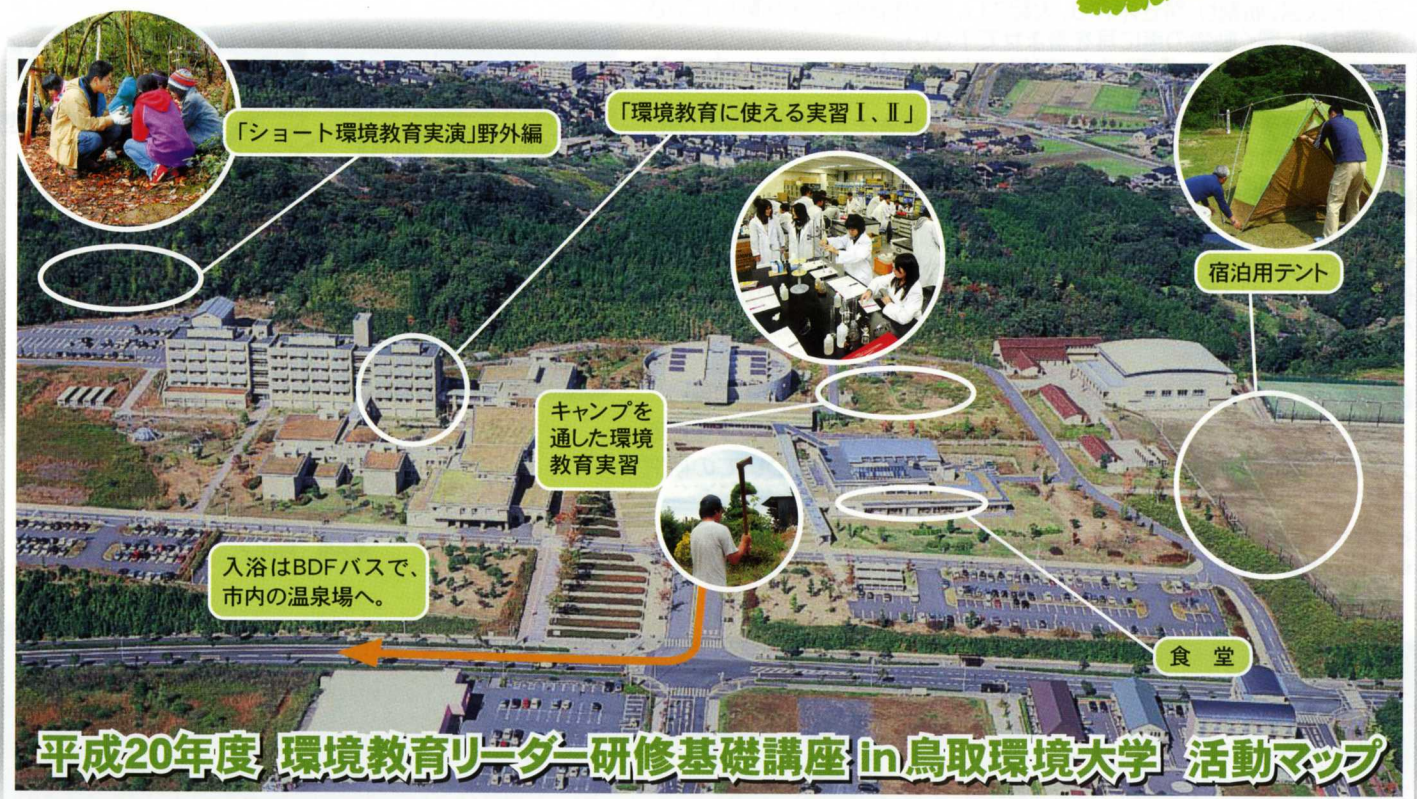
平成20年度 環境教育リーダー研修基礎講座 in 鳥取環境大学 活動マップ

鳥取環境大学構内 (鳥取県鳥取市若葉台北一丁目1番1号) 企画交流課/TEL.0857-38-6704 FAX.0857-38-6709