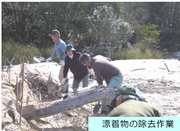
漂着物の除去作業