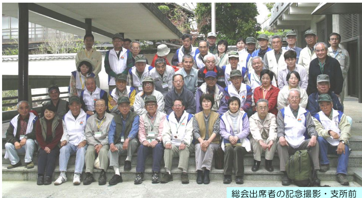
総会出席者の記念撮影・支所前