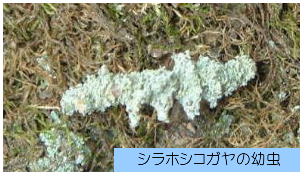
シラホシコガヤの幼虫

古い梅の木には、「ウメノキゴケ」や「オオマツゲゴケ」の地衣類の植物が張り付いていました。そのとき、ウメノキゴケが動いたようなので目を凝らして見ると、確かに1センチくらいのウメノキゴケが動くのです。その動きは、シャクトリムシが這うように見えました。咄嗟に、虫の「擬態」だと思いました。皆んなこの不思議な虫に見入っていました。