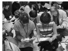
対話の練習の様子