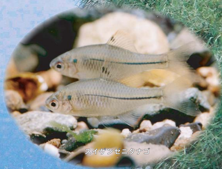
スイゲンゼニタナゴ

アユモドキとスイゲンゼニタナゴは、絶滅のおそれがきわめて高いことから、「種の保存法」で捕獲や販売、譲渡などが禁止されています※。