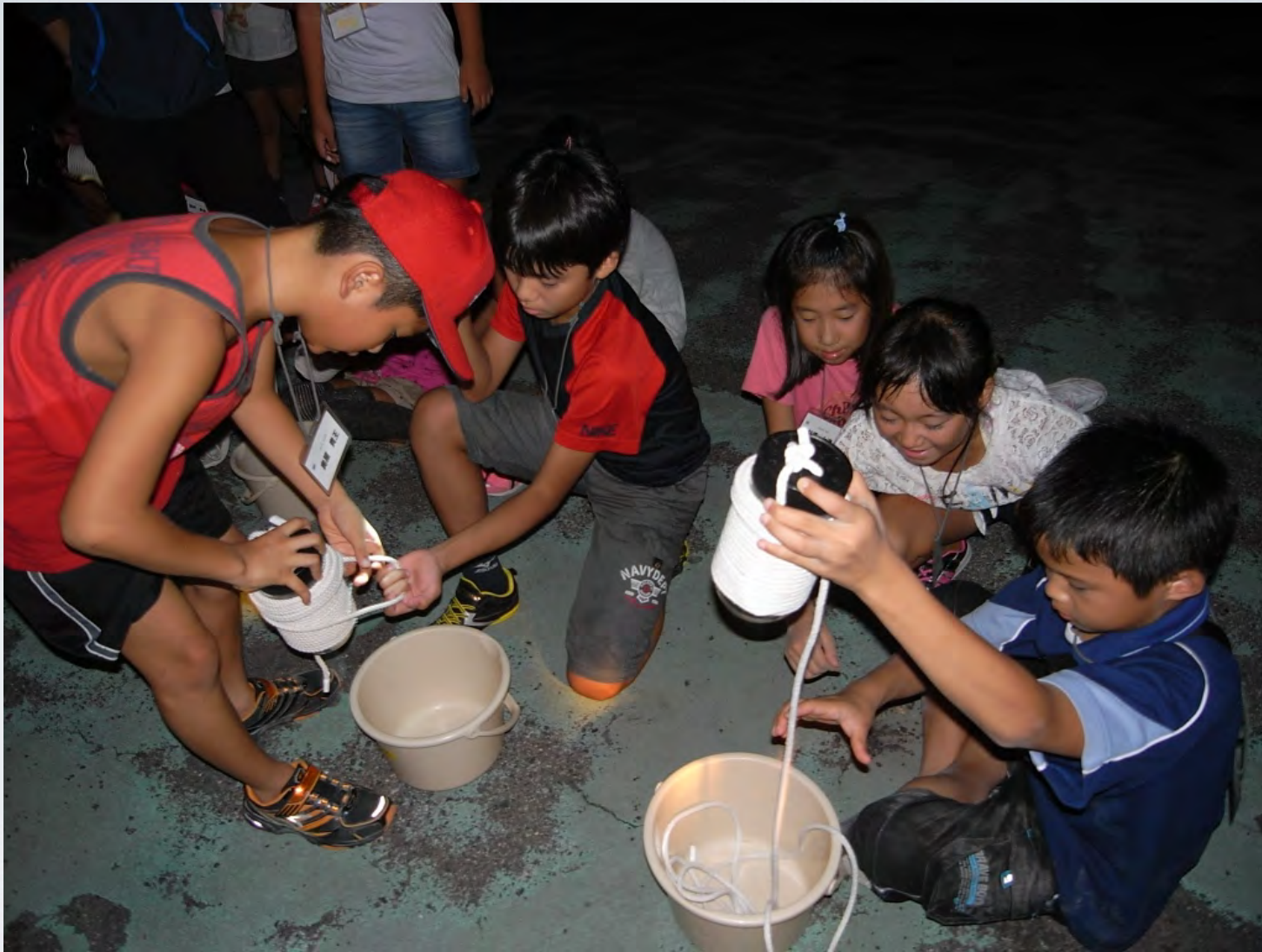
夜の海 仕かけに集まる 海ほたる ゆうか