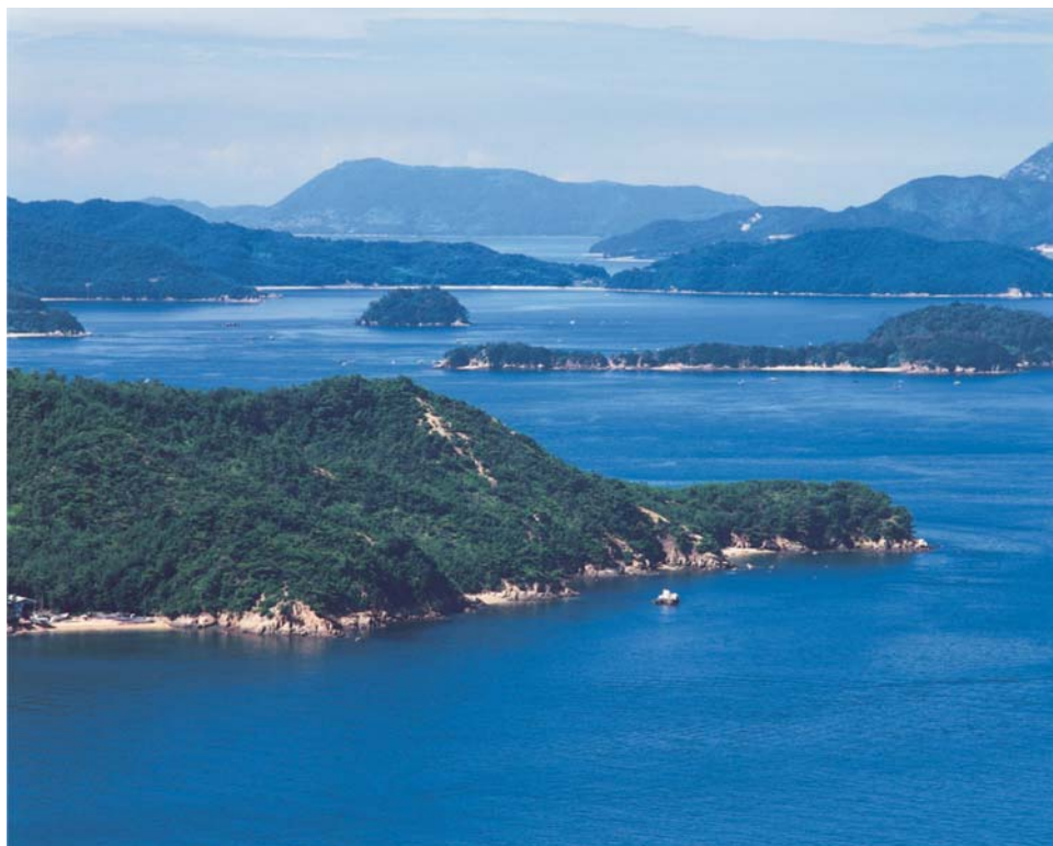
備讃瀬戸（塩飽諸島）