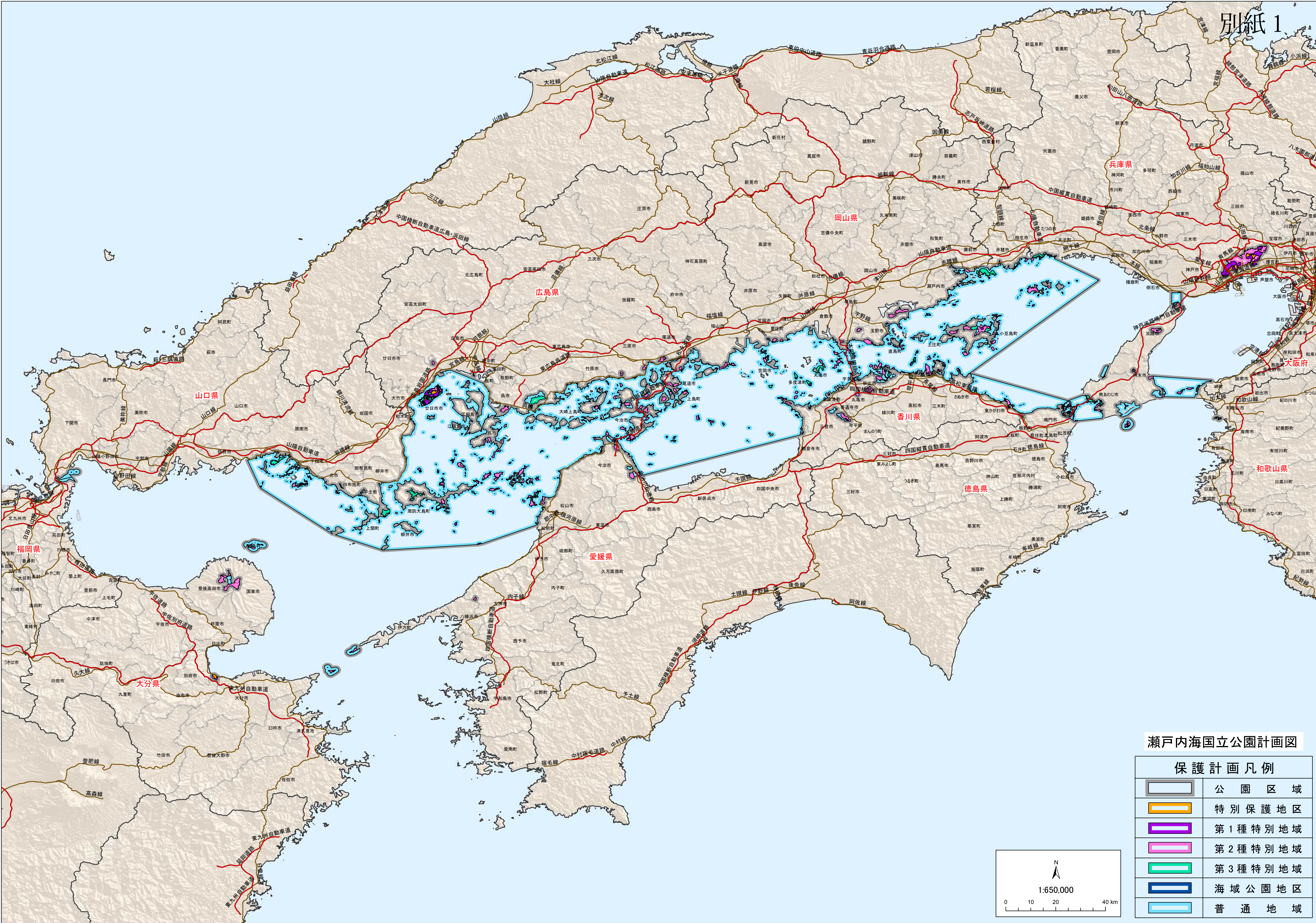
瀬戸内海国立公園計画図