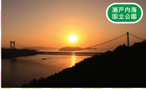
瀬戸内海 国立公園