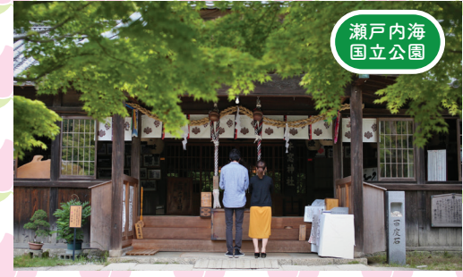
瀬戸内海 国立公園