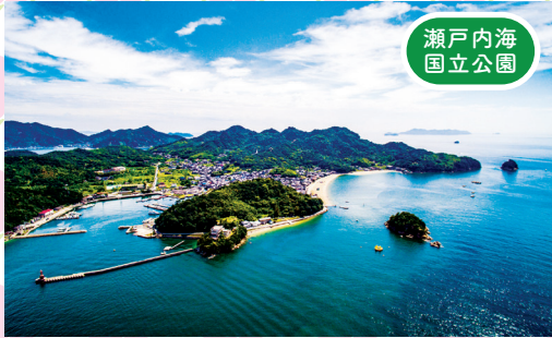
瀬戸内海 国立公園