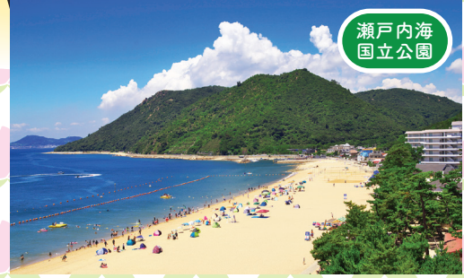
瀬戸内海 国立公園