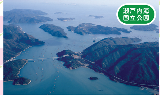
瀬戸内海 国立公園