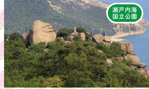
瀬戸内海 国立公園