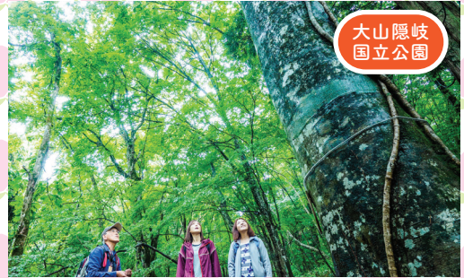
大山隠岐 国立公園