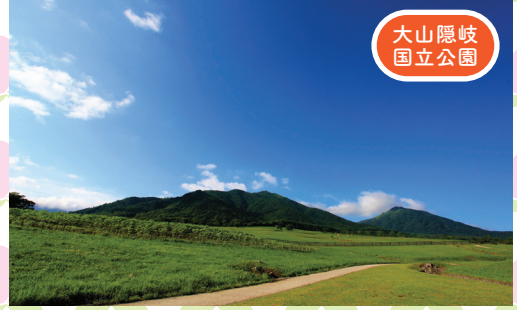
大山隠岐 国立公園