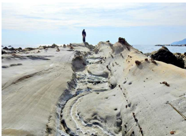
足摺宇和海国立公園

すばらしい自然や景色がある国立公園、沢山の生き物が棲んでいる国指定鳥獣保護区。そこで、環境省の自然保護官（レンジャー）と自然保護官補佐（アクティブ・レンジャー）は活躍しています。自然活用や保護の中で出会った魅力あるシーンをアクティブ・レンジャーが写真やパネルで紹介합니다。