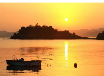
瀬戸内海国立公園