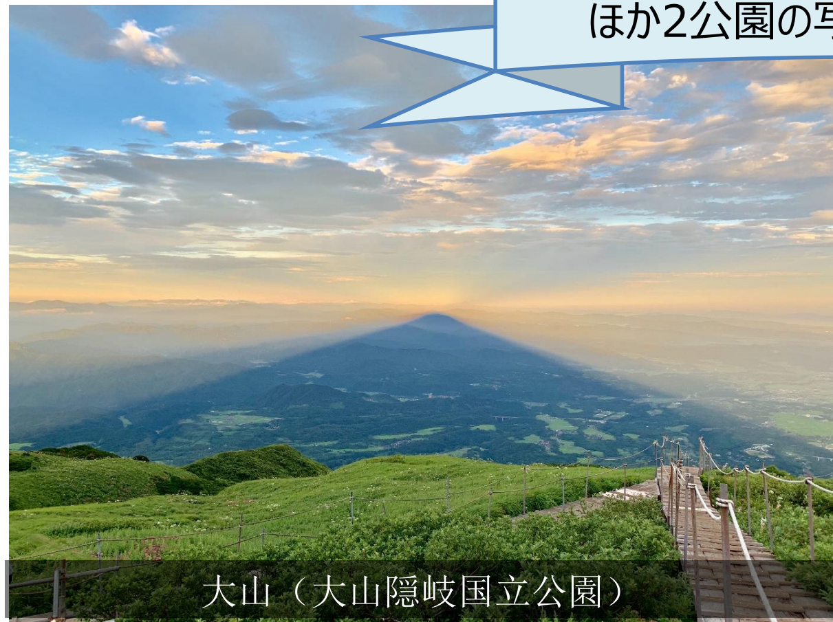
大山（大山隠岐国立公園）