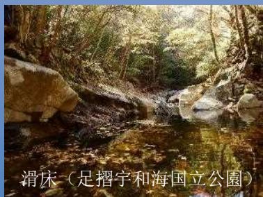
滑床（足摺宇和海国立公園）