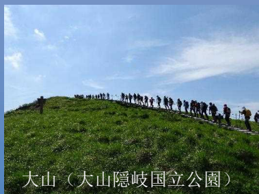
大山（大山隠岐国立公園）

国立公園は、日本を代表する自然の風景地を保護し、自然とふれあうことを目的とした制度です。自然保護官（レンジャー）の補佐役として国立公園のパトロールや調査、自然解説などを行うアクティブ・レンジャーが、中国四国の国立公園の美しい自然や自然を守る取組を写真とパネルでご紹介します。