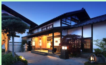
宿泊施設の高付加価値