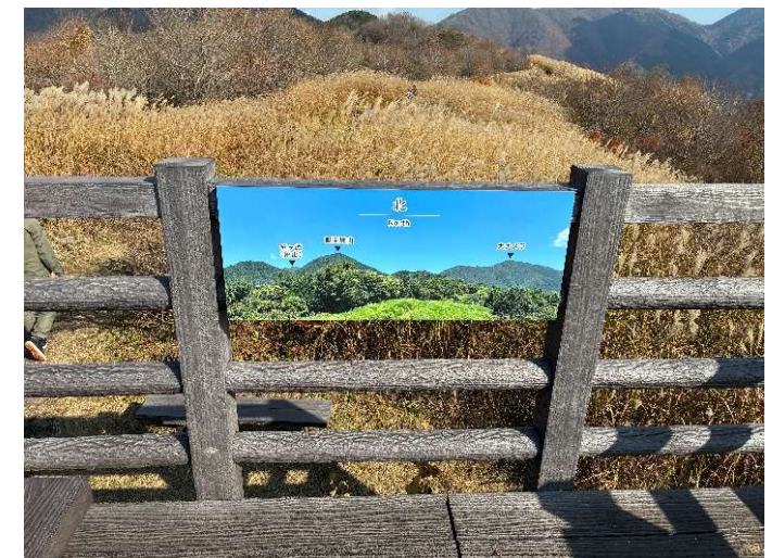
パネル標識設置【R7年度】