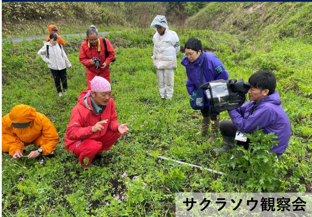
サクラソウ観察会