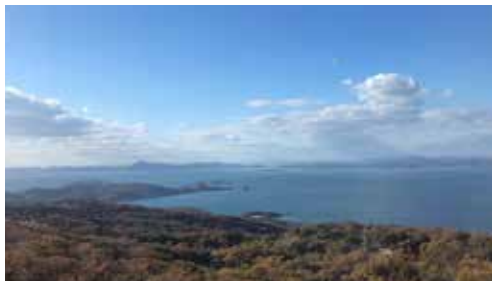
展望台からの眺望

観音様の視線の先には絶景が広がっていた。小豆島にある「小豆島大観音」はしあわせ観音様とも呼ばれ、フランスの建築コンテストで一位を獲得したことがある観音様です。胸元にある展望台まではエレベーターで上がることができ、瀬戸内海を見渡すことができる知る人ぞ知る絶景スポットです。