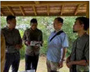
環境省職員の説明に耳を傾ける

昨夏、インドネシアの環境林業省の職員が日本の国立公園の視察のため来日した。度重なるスケジュール変更にもめげず、2日間にわたり鷲羽山と蒜山を訪問した。