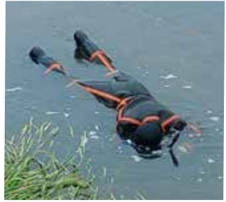
なんと、この体勢で7時間

岡山県内にて絶滅危惧種のアユモドキ、スイゲンゼニタナゴが環境省職員により撮影された。アユモドキは京都府と岡山県の一部、スイゲンゼニタナゴは岡山県、広島県の一部のみに生息している。おとなのアユモドキ(上)は警戒心が強く、撮影に苦労したとのこと。撮影時間は1日7時間、2日間で計14時間とまさに執念の賜物である。