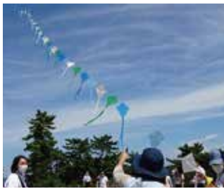
青空に舞い上がる連風