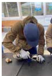
殻むきに苦戦する参加者

11月25日に瀬戸内海国立公園90周年記念「ラ・マル・ド・ボワ」で行く瀬戸内海の人と自然にふれあう旅が開催された。参加者は岡山駅より観光列車に乗車、ひなせうみラポにて地域の人と海ごみ拾いやカキ殻むきを体験した。また、環境省職員から瀬戸内海国立公園の指定の経緯について説明を受け、瀬戸内海について理解を深めた一日となった。