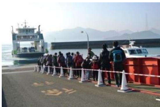
忠海港 大三島フェリー乗船風景

この度も講師、地元のみなさまのご協力のもと、無事に終了することができました。どうもありがとうございました。