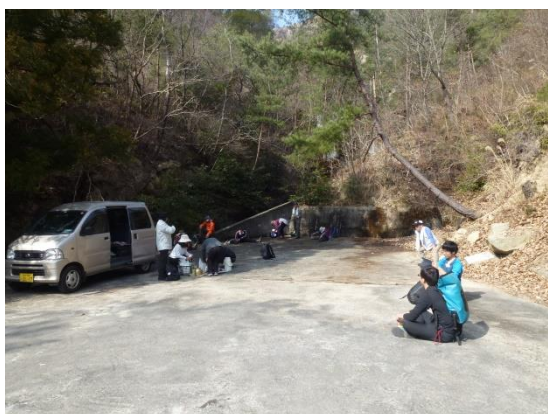
お接待(休憩) ・大三島を守る会