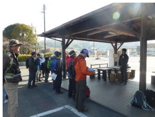
開会あいさつ(関自然保護官)