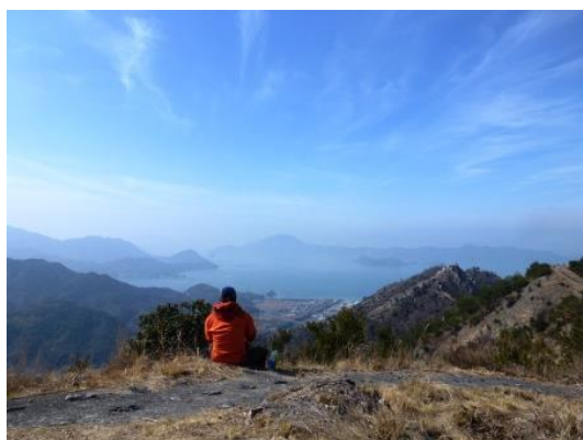
安神山 尾根道風景 ・昼食,休憩