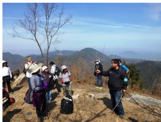
安神山 山頂 ・オガルカヤ,メリケンカルカヤについて