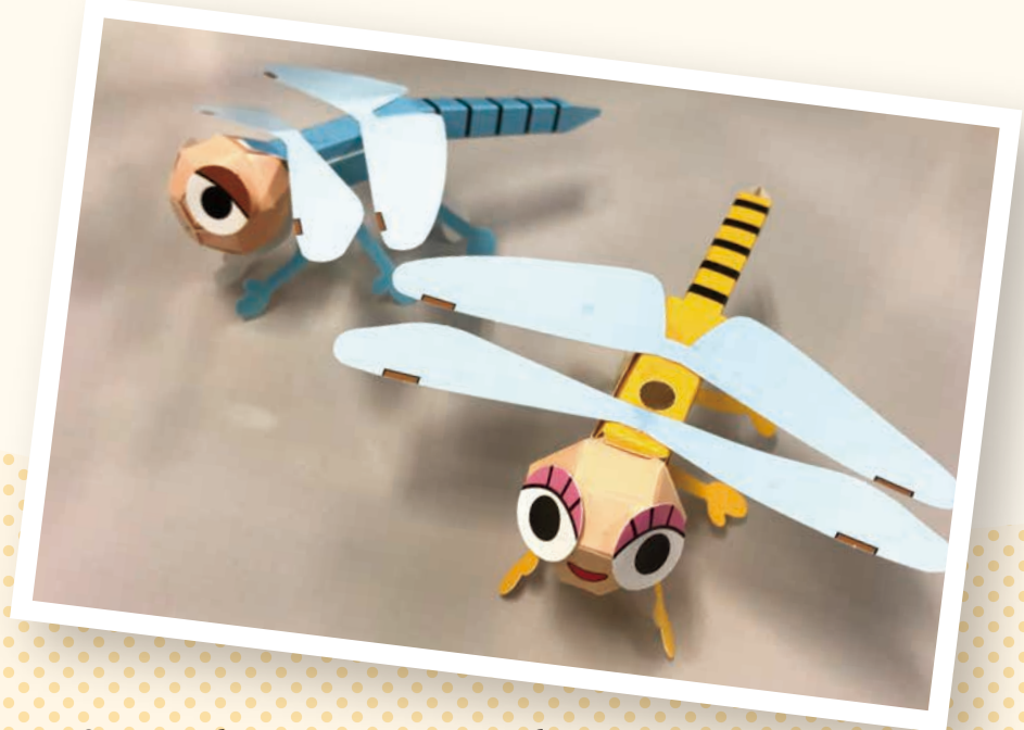
トンキーとアッキーのペーパークラフト配布中！