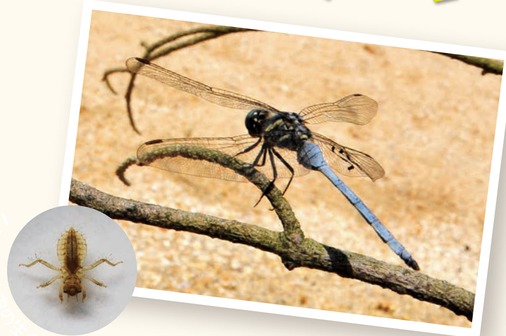
ミヤジマトンボの保護の必要性を学ぼう！