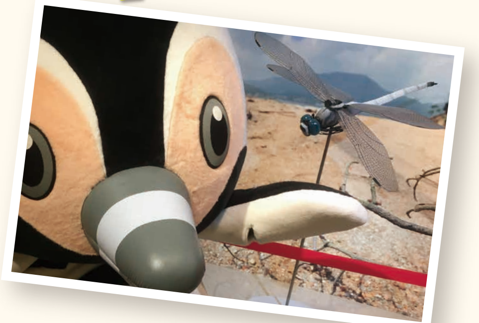
ミヤジマトンボの20倍型模型！一緒に写真も撮れちゃう！