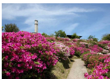
大山隠岐国立公園