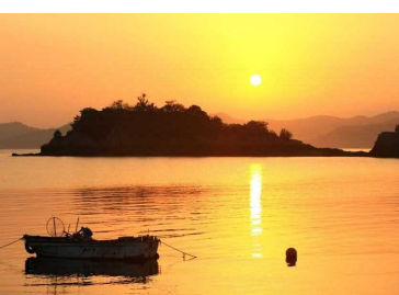
瀬戸内海国立公園