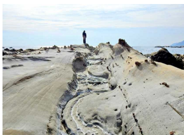
足摺宇和海国立公園