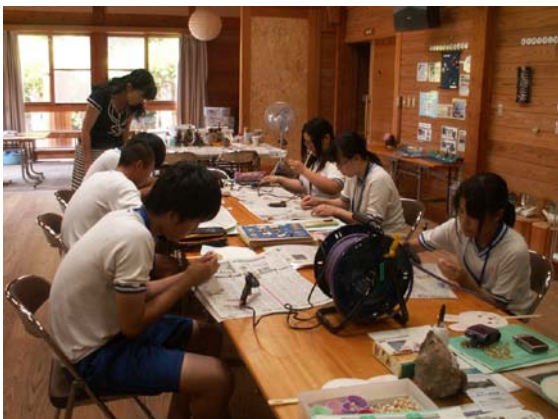
【クラフト体験受け入れ準備】