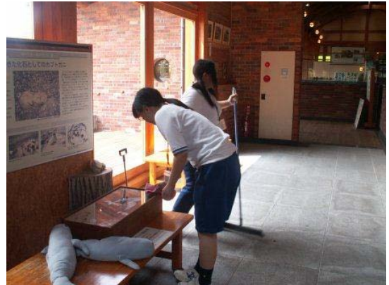
【ビジターセンター館内清掃】