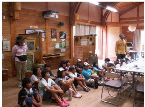
【団体受け入れ(忠海東小学校 11名)】

・作り方を覚えるために、見本作りをしました。この後、小学生の前で説明できるかな？