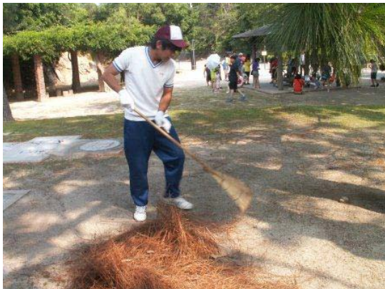
【ビジターセンター館外清掃】

今回は、広島県立忠海高等学校の生徒さんたちの就業体験の様子をみなさんにご紹介させていただきます。