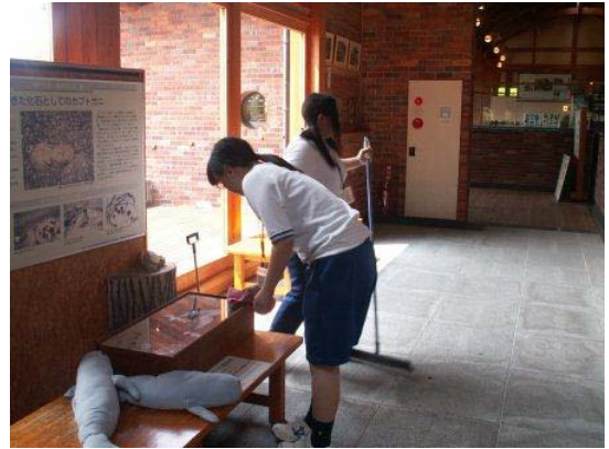
【ビジターセンター館内清掃】