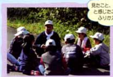
見たこと、聞いたこ と感じたことなど ふりがえそう