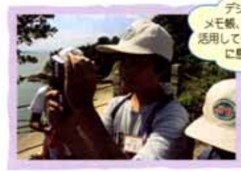
デジカメや メモ帳、地図などを 活用してグループごと に島を探検