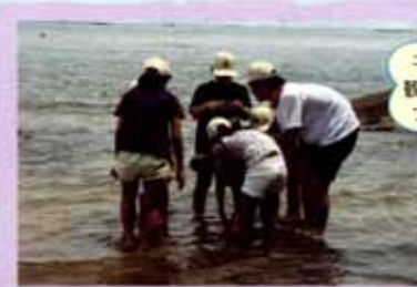
干潟に種々の生物を 観察。ウミウシを見 つけた班もあった