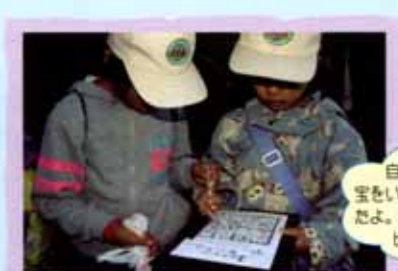
自然の中で 宝をいっぱい見つけ たよ。あとひとつで ピンゴ!