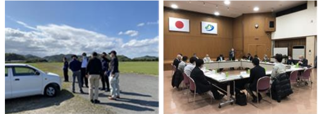
写真 現地調査（左）意見交換会（右）の様子

さらに、自治体担当者と合同で地域の一般廃棄物処理施設や仮置場候補地などの現地調査を実施し、実効的な災害廃棄物対策への認識を高めることができた。