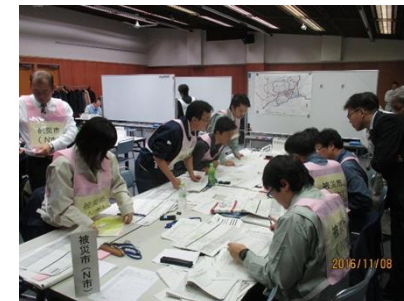
図上訓練(イメージ)

他にも資料編に、仮置場の選定基準や留意点、協定締結書例など、平時の備えとして参考となる資料を掲載。実際の災害時に使用する様式集も作成。