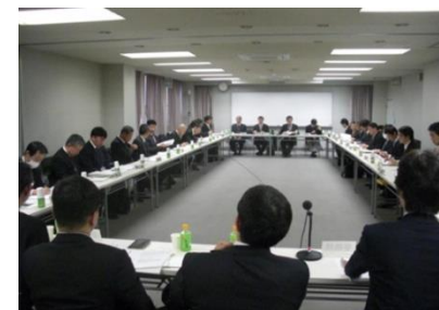
ブロック協議会(イメージ)