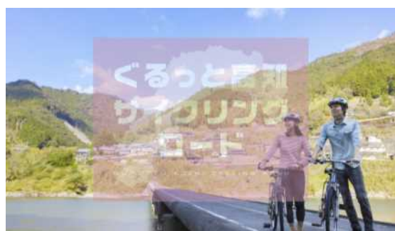
ぐるっと高知サイクリングロードのホームページ