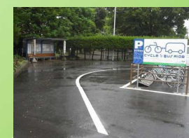
サイクルアンドバスライド駐輪場(茅ヶ崎市)

買物客利用などの自転車に対応した利便性の高い路上自転車駐車場の整備と、気軽に利用できる料金システム