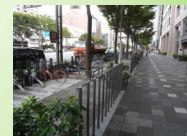
路上の駐輪スポット(京都市)