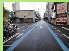
区画道路における走行空間整備(高松市)

歩行者優先のアーケード等を代替するため、区画道路や公園用地などを活用した走行空間整備