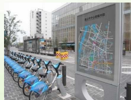
公共交通と連携した コミュニティサイクル(富山市)