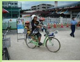
保護者を対象とした幼児二人同乗用自転車の交通安全教室