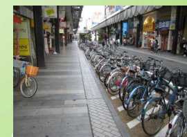
商店街の駐輪スポット(盛岡市)