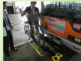
自転車ラックバス (神奈川県)