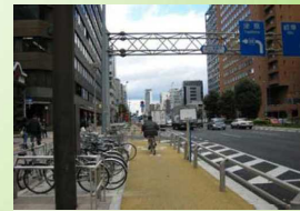
駐輪場と一体整備された走行空間(名古屋市)