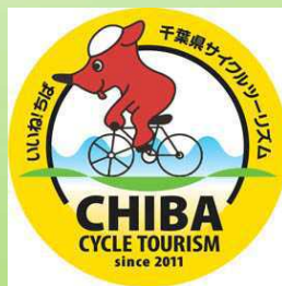
サイクルツーリズム(千葉県)