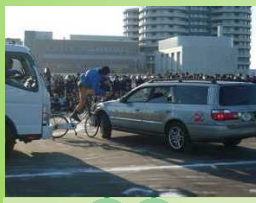
自転車安全教育の推進