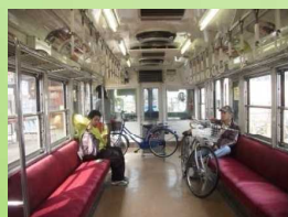
サイクルトレイン