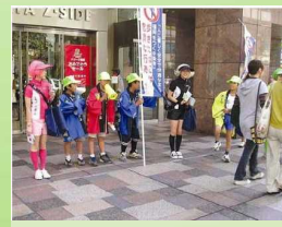
街頭での啓発活動(福岡市)