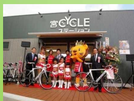
様々なサービス提供を行う サイクルステーション(宇都宮市)

サイクルツアーやロードレース等の各種イベント開催や、観光・サイクリングルートへの創出、自転車マップの作成、休憩スポット確保