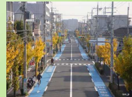
連続的な走行空間整備(尼崎市)

主要路線において、都心部と郊外部を接続する幹線ネットワークを整備(自転車通勤の推進による自家用車からの転換)