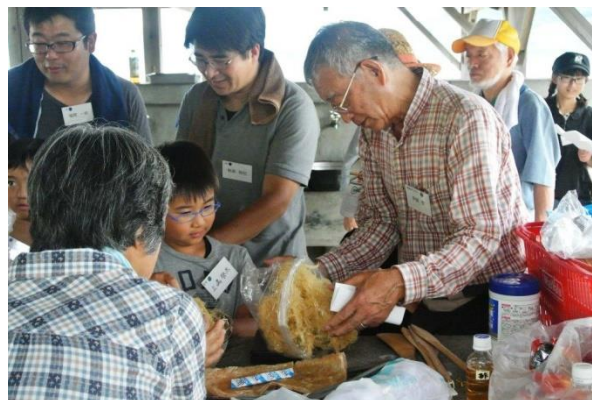
トコロテン作り ・テングサの重さを計っているところ