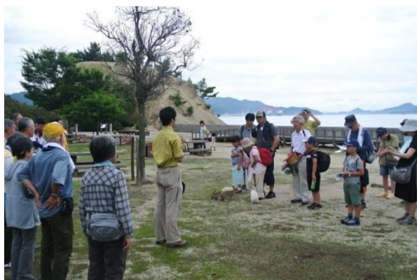
関自然保護官による開会あいさつ

この度も講師のご協力のもと、無事に終了することができました。どうもありがとうございました。